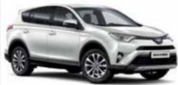
070 Білий перламутр 5