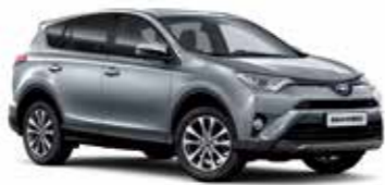
106 Сріблястий 5