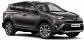
4U5 Темно-коричневий 5

Вся інформація, представлена у цьому матеріалі, є точною та дійсною станом на дату публікації 06.03.2018.