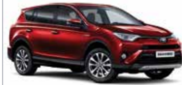
3ТЗ Червоний 5