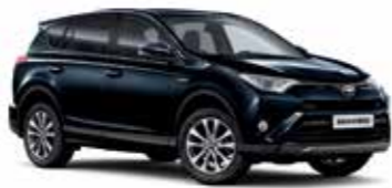
221 Темно-синій 5