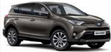
4ТЗ Бронзовий 5