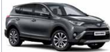
163 Сірий 5