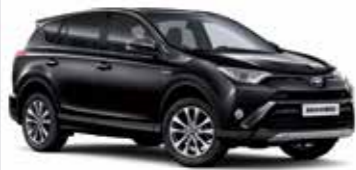
209 Чорний 5